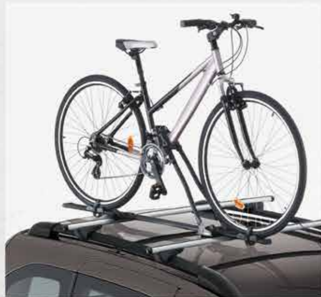
Велобагажник на дах