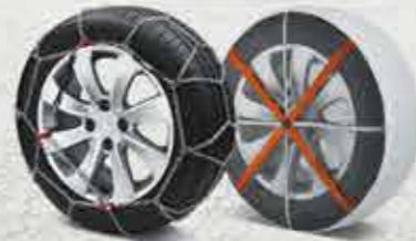
Ланцюги проти ковзання / протибуксирвальні чохла