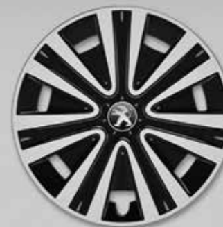
Ковпак Nateo 15 2