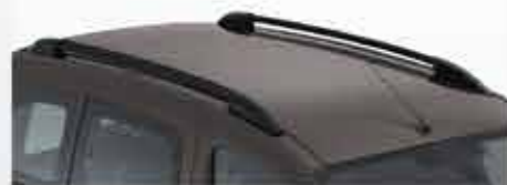
✘ Рейлінги на дах поздовжні

Ваш PEUGEOT Partner Tepee знає, як під час відпочинку та пригод пристосуватися до ваших побажань! Відкрийте для себе аксесуари для перевезення багажу на даху чи на фаркопі для збільшення вантажності вашого автомобіля.