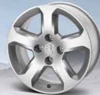
✘ Легкосплавний диск Arenal 16"