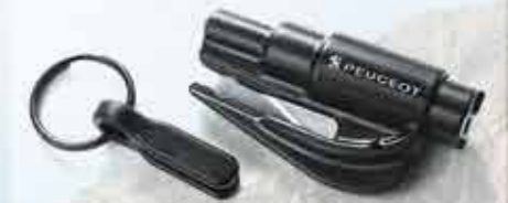
Ніж для розрізання пасків безпеки з молотком (на брелоку) для розбивання скла. Полегшує вихід з автомобіля у разі аварії