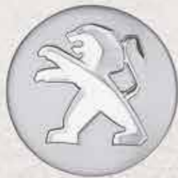
✘ Захисний ковпак «Сірий алюміній»