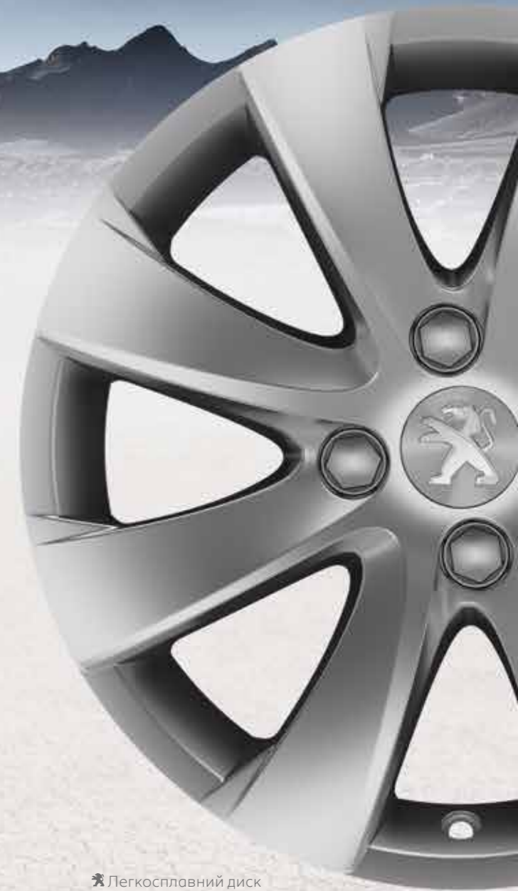
✘ Легкосплавний диск Managua 16"

* Диск продаються без гвинтів та заглушок.