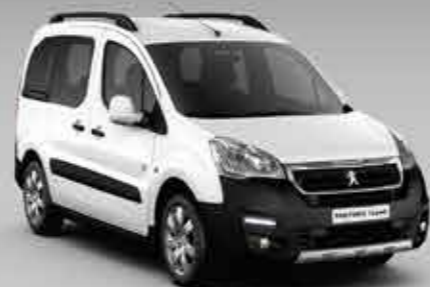
Білий айсберг (Blanc Banquise)