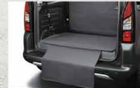
Чохол для багажника