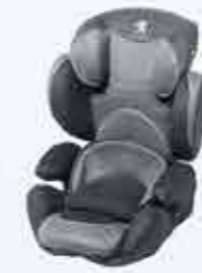
Дитяче автокрісло Kiddy Comfort Pro, вікова група: 2, 3