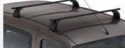
✘ Класичні поперечні рейлінги на дах