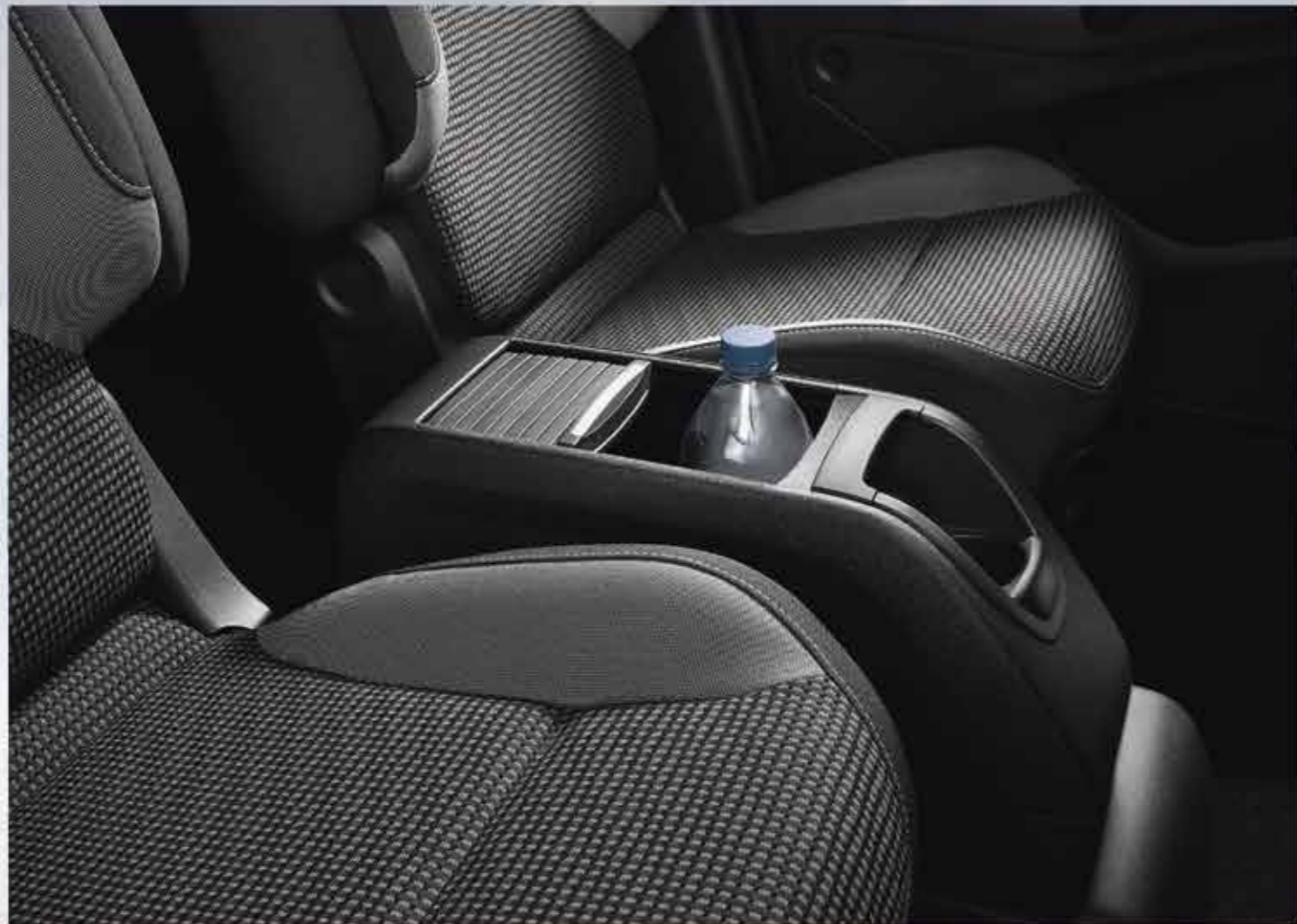
Висувна передня консоль

PEUGEOT пропонує вам гаму аксесуарів, призначених для якнайкращого облаштування салону PEUGEOT Partner Терее відповідно до ваших потреб у розташуванні та практичності.