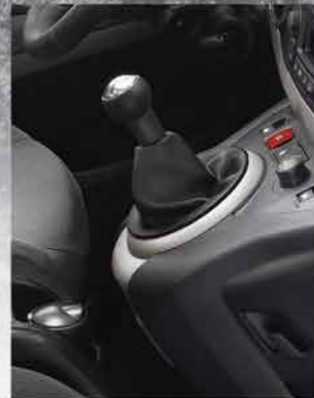
Пересувна попільничка та прикурювач