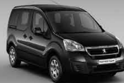
Чорний онікс (Noir Onyx) 2