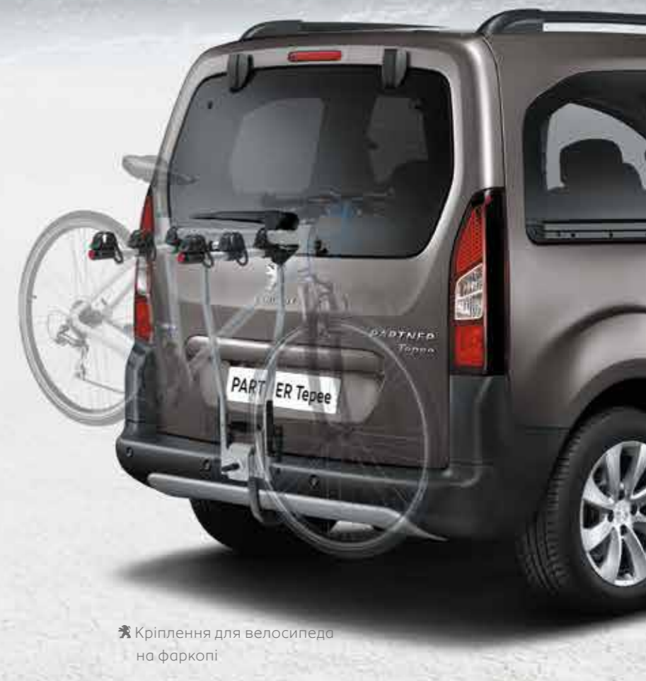
✘ Кріплення для велосипеда на фаркопі