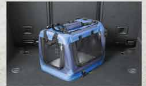
Клітка для перевезення тварин