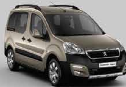
Горіховий (Nocciola) 1