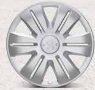
Захисний ковпак Gris Etincelle