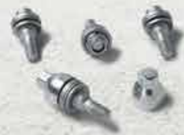
Секретні колісні болти