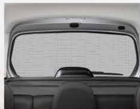
Сонцезахисна шторка для заднього скла