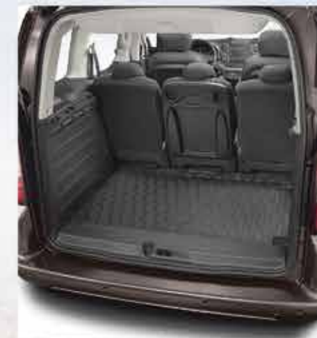
✘ Килимок гумовий для багажника