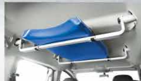
✘ Набір внутрішніх рейлінгів на дах