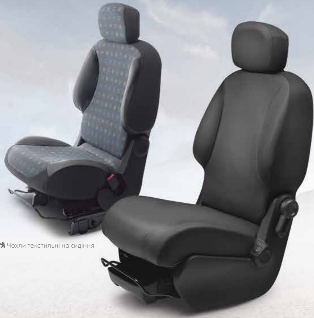
🐾 Чохли текстильні на сидіння

Чохли на сидіння та килимки неодмінно захистять ваш автомобіль. Відкрийте для себе широкий вибір аксесуарів, призначених для вашого Partner Tepee.