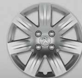
Ковпак Grenade 16 3