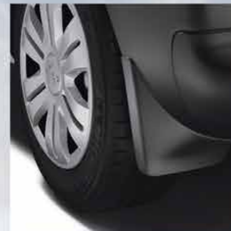
✘ Стильні задні бризковики