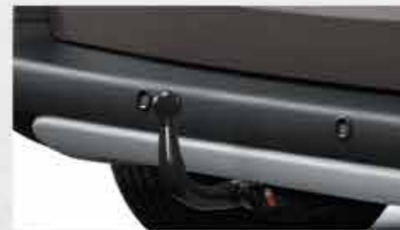
✘ Фаркоп, що демонтується без інструментів