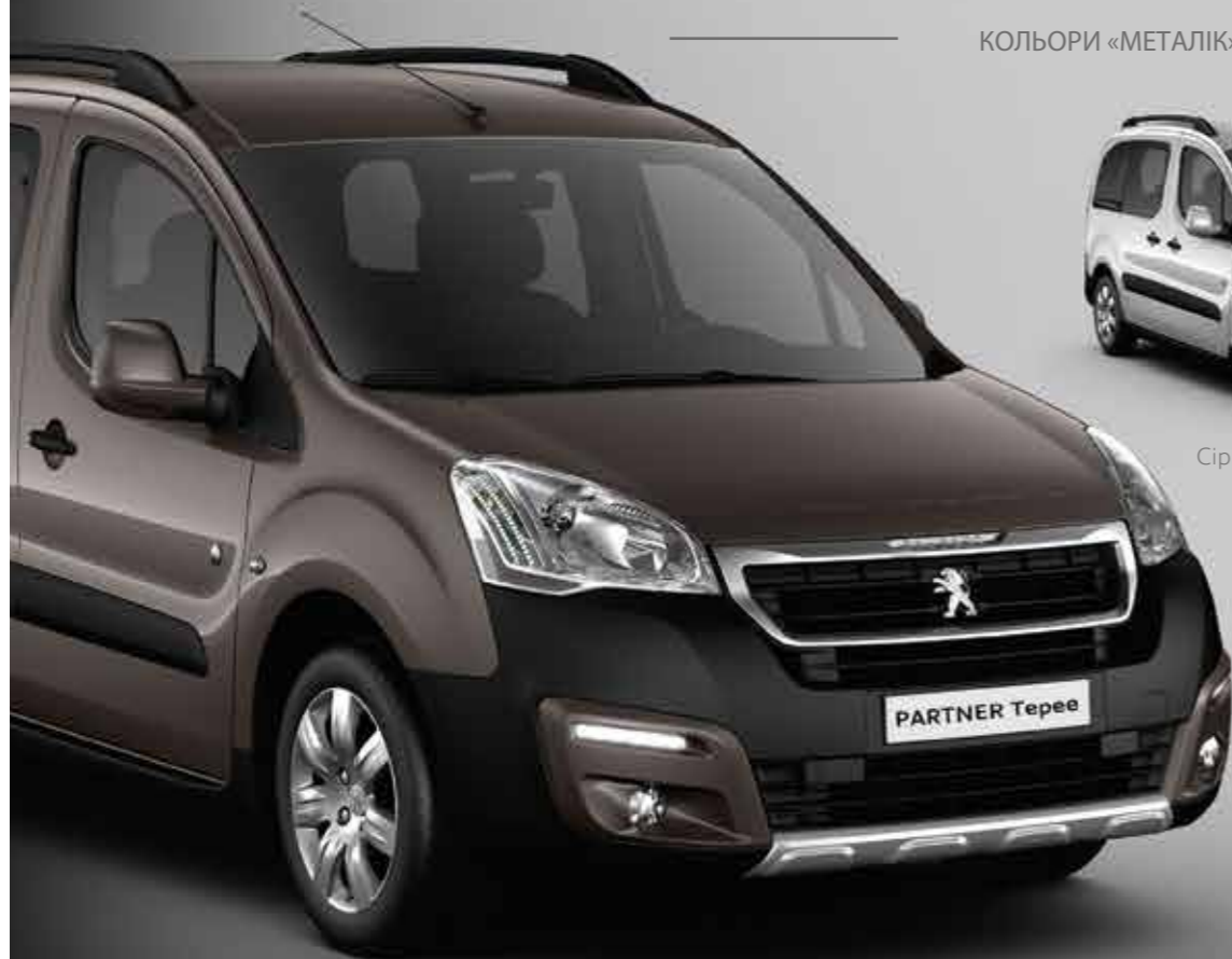
Сірий мока (Gris Moka) 1