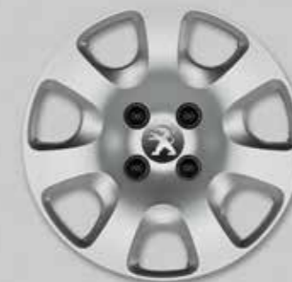
Ковпак Atacama 15 1