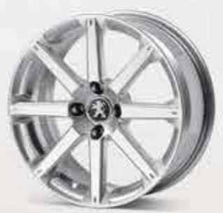
✘ Легкосплавний диск Jordan R 17"