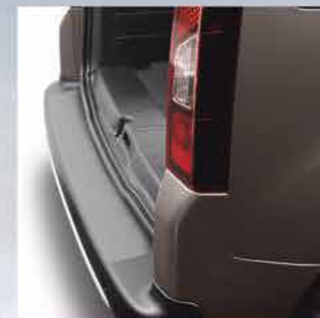
✘ Захисна накладка на поріг багажника