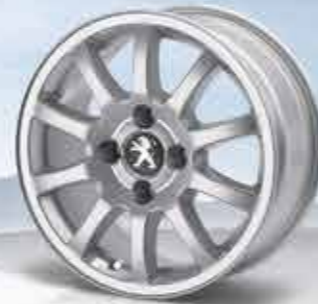
✘ Легкосплавний диск Twenty First 15"