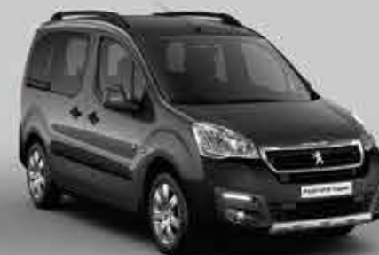
Сіра акула (Gris Shark)