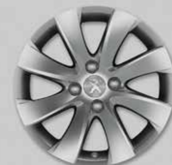
Диск алюмінієвий Managua 16 4