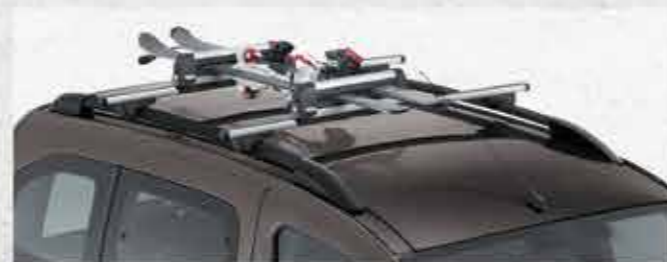
Кріплення для лиж