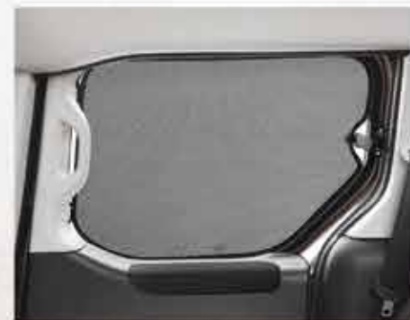
Сонцезахисні шторки для заднього бічного скла