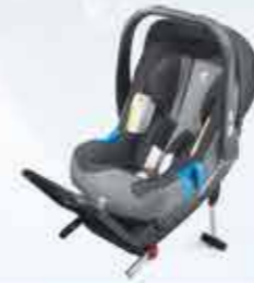
Дитяче автокрісло Romer baby-safe + та кріплення Isofix, вікова група: 0+