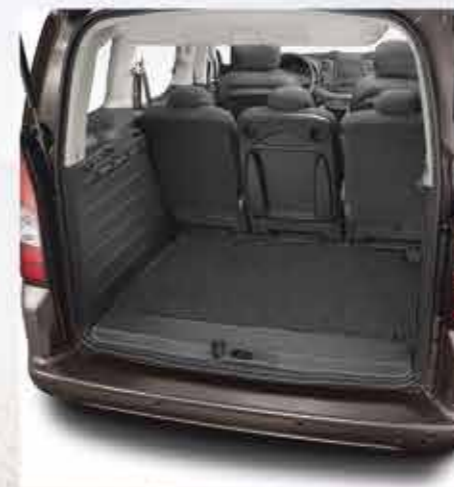
✘ Килимок ворсовий для багажника