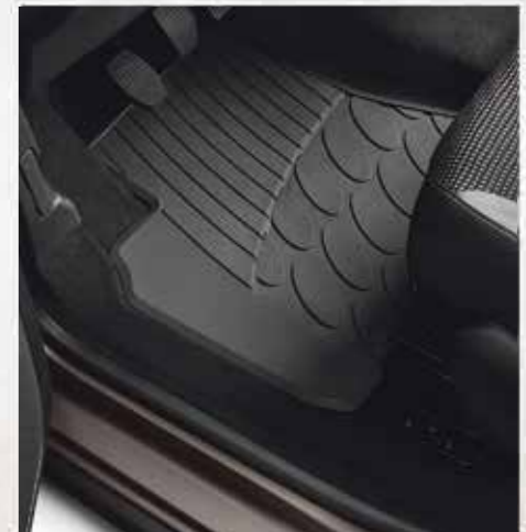
🐾 Набір гумових килимків