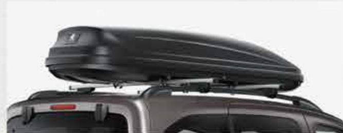
Тверді та м'які багажники на дах