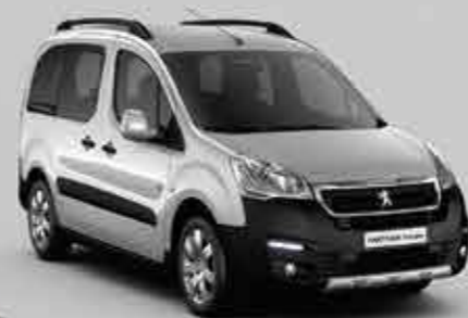
Сірий алюміній (Gris Aluminium)