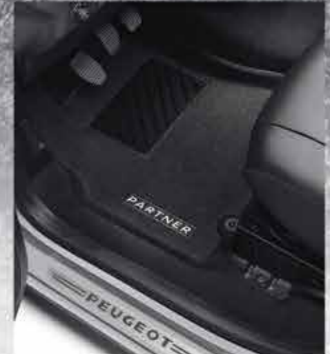
🐾 Набір ворсових формованих килимків