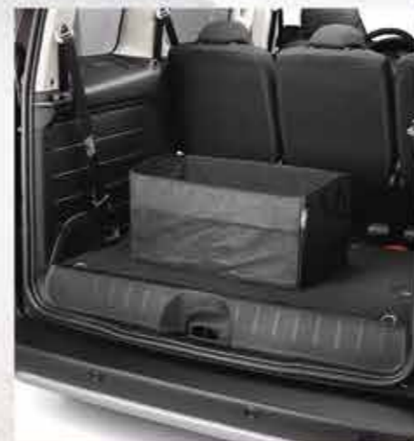
Сумка для багажника