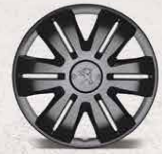
Захисний ковпак Gris Storm