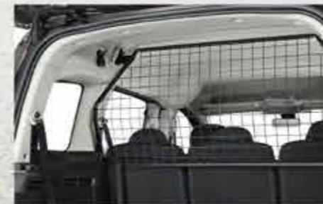
Решітка для перевезення собак