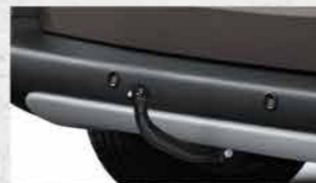
✘ Фаркоп із С-подібним шарніром