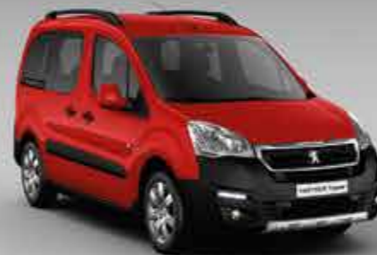
Пекучий червоний (Rouge Ardent)