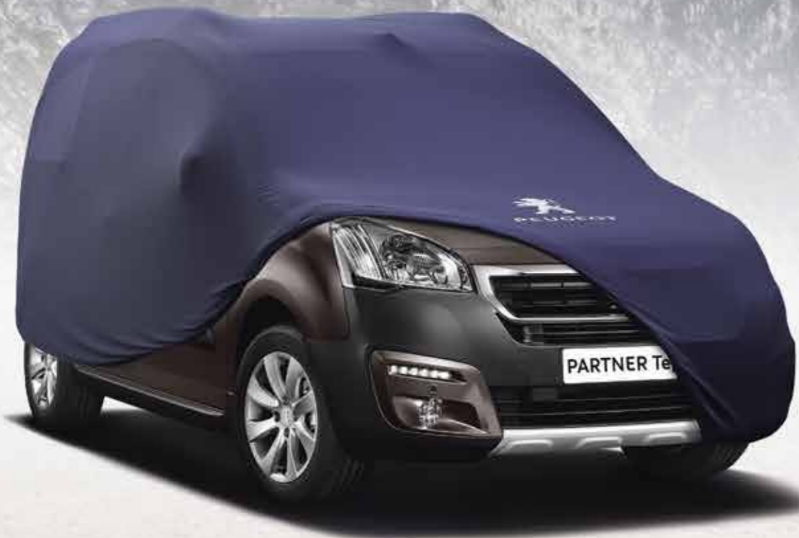
Захисний чохол для внутрішнього паркінгу (розмір 4)