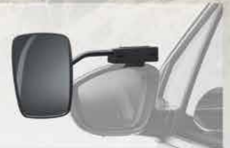
Дзеркало заднього виду пересувне