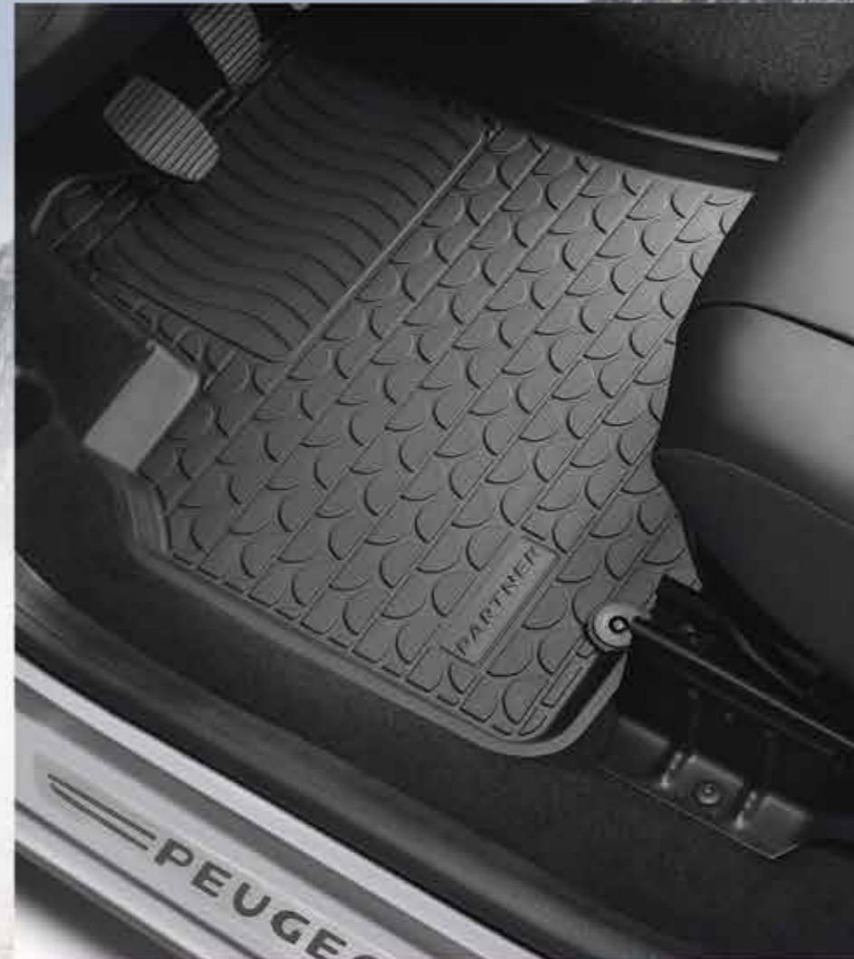
🐾 Набір гумових формованих килимків