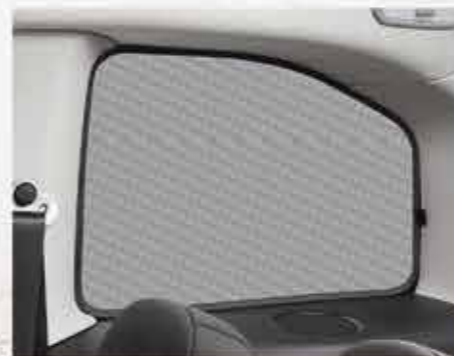
Сонцезахисні віконні шторки для бічних розсувних дверей