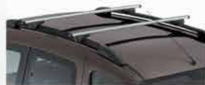
✘ Поперечні рейлінги на дах та поздовжні рейлінги