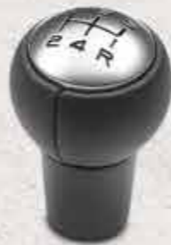
✘ Насадка важеля перемикання передач із чорної шкіри та з хромованою вставкою