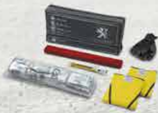
Світловідбивний жилет, знак аварійної зупинки