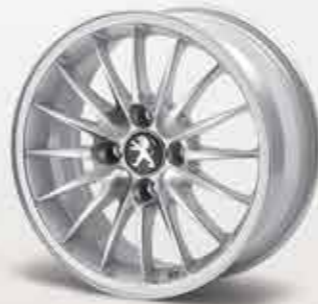
✘ Легкосплавний диск Jet 15"