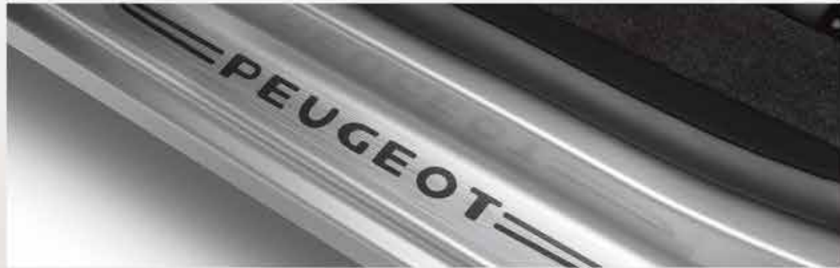
✘ Набір із накладок на пороги передніх дверей під матову нержавку сталь

Збираючись у подорож, потурбуйтеся, щоб ваш новий Partner Терее мав стильний вигляд. Для цього скористайтесь широким асортиментом аксесуарів, спеціально розроблених для того, щоб ваш новий Partner Терее став більш вишуканим. Надайте індивідуальності вигляду вашого PEUGEOT Partner Терее за допомогою легкосплавних дисків* спокливого дизайну!