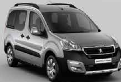
Сірий (Artense) 1