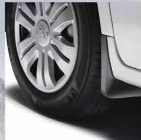
✘ Стильні передні бризковики

Захистіть ваш PEUGEOT Partner Тереє від непередбачуваних випадків завдяки спеціально призначених для цього аксесуарів. Так ви зможете зберегти його естетичний вигляд та подовжити строк його служби.