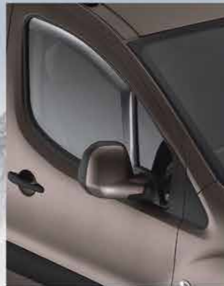
Комплект дефлекторів передніх дверей